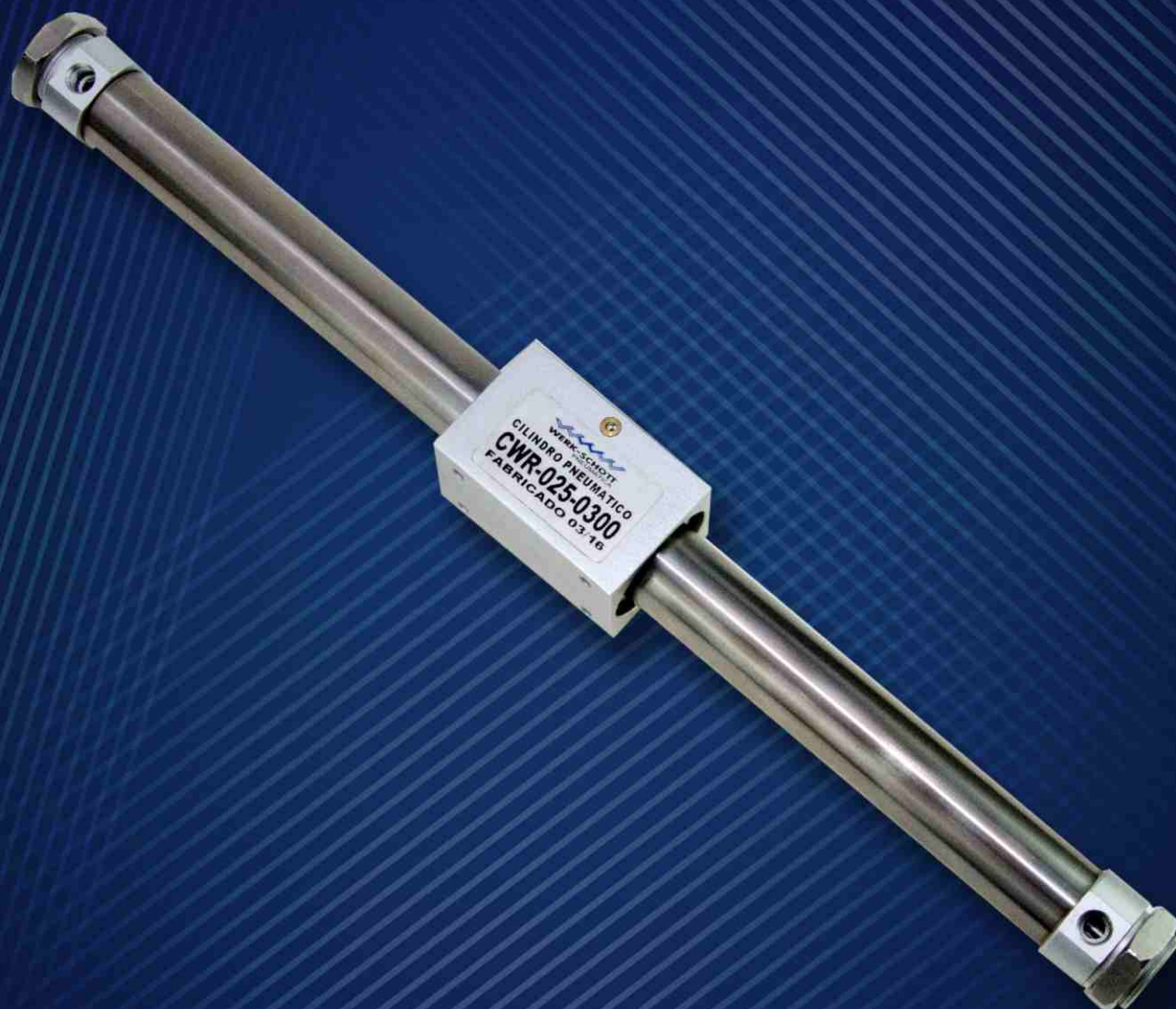
Cilindro sem Haste de Acoplamento Magnético Série CWR